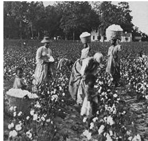
Schiavi al lavoro nei campi di cotone